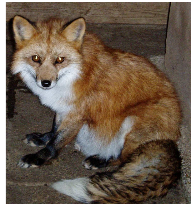
En af vores fem ræve (12 år) i sin vinterpels